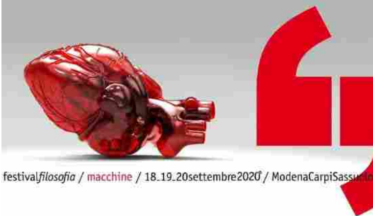
festivalfilosofia / macchine / 18.19.20settembre2020 / ModenaCarpiSassuolo

Un cuore rosso, tecnologia e passione per celebrare il ventennale della manifestazione. Immagine realizzata da Ernesto Tuliozi