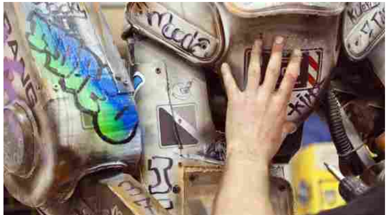
Consorzio creativo - Un'opera realizzata dall'artista LABADANzky

Giunto alla ventesima edizione, il format prevede lezioni magistrali, mostre, spettacoli, letture, attività per ragazzi e cene filosofiche da venerdì 18 a domenica 20 settembre. Ecco il programma e come prenotarsi